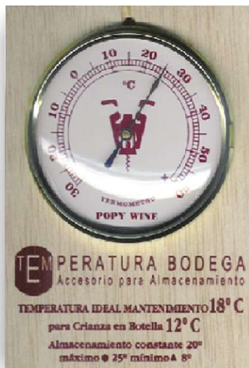
375/02 Termómetro bodega madera embalaje: caja cartón · caprichos del vino