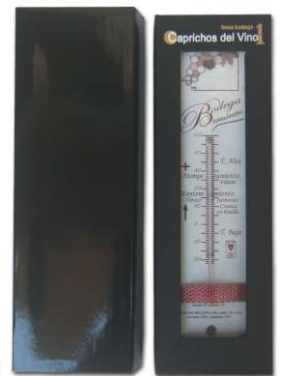
494 Termómetro pared embalaje: caja cartón