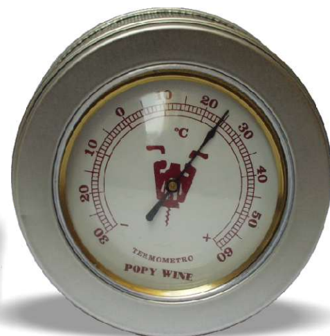
375/23 Termómetro mi bodega embalaje: caja metal redonda