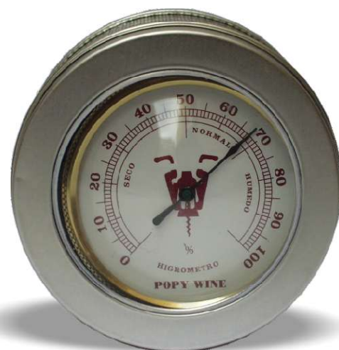
376/02 Higrómetro mi bodega embalaje: caja metal redonda