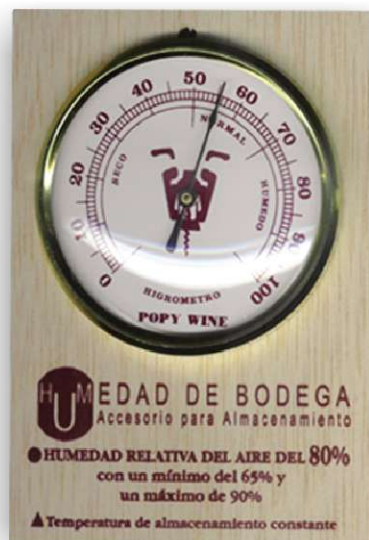
375/02 Higrómetro bodega madera embalaje: caja cartón · caprichos del vino